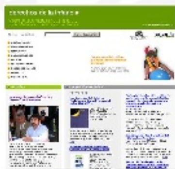
Home page del sitio web Derechosdelainfancia.cl