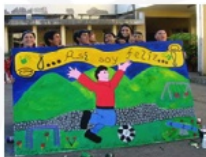
Capacitaciones a World Vision Concepción