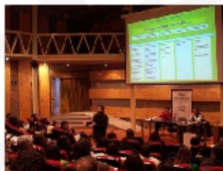
Seminario sobre trabajo con jóvenes que han agredido sexualmente