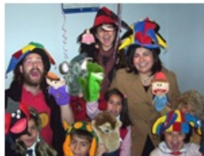
Talleres Centro Newen Viña del Mar