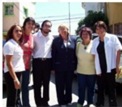
Presidenta Michelle Bachelet con parte del equipo de Paicabí en la inauguración del Centro Antú en Valparaíso