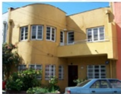
Centro Antú Valparaíso