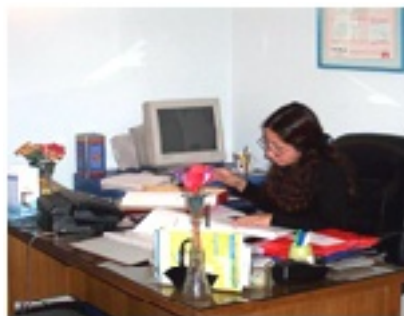
Oficinas Centro Newen Viña del Mar