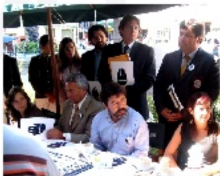
Conferencia de prensa lanzamiento de la Campaña No Hay Excusas Valparaíso