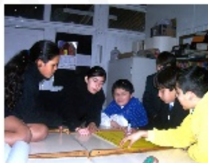
Talleres de Prevención de la violencia escolar: "La Escuela un Territorio de Paz", en Valparaíso