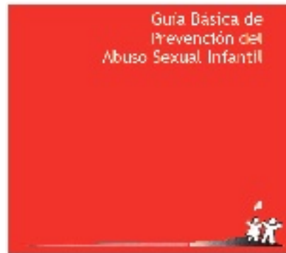
Guía Básica de Prevención del Abuso Sexual Infantil

Nuestra inspiración está no sólo en la idea que nuestros niños son el futuro, más bien son el presente y es hoy cuando debemos protegerlos y hacerlos crecer en una sociedad más justa, que respete su dignidad y derechos.