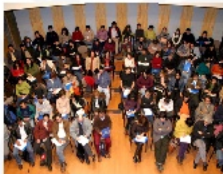
Escuela itinerante para ONGs Valparaíso