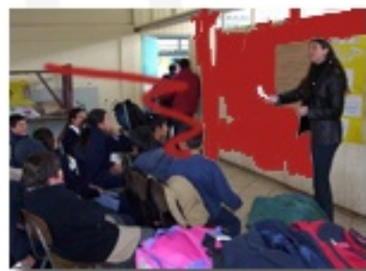
Prevención Violencia Escolar Pob. Glorias Navales, Viña del Mar